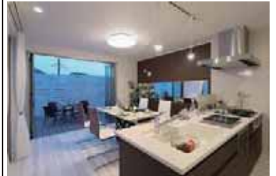
ダイニングルーム