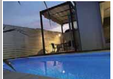
パーゴラ付きオープンエアダイニング