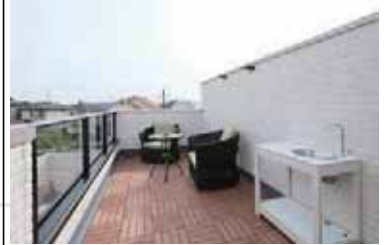
ガーデンシンク付きラナイ